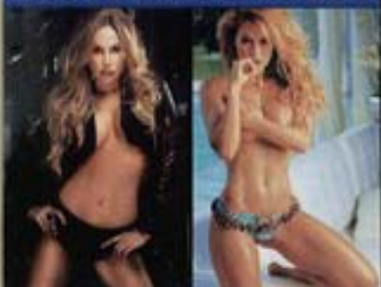
LAS MUJERES DE LOS ACTORES DEL CULEBRÓN